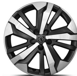
17" zliatinové disky AORAKI