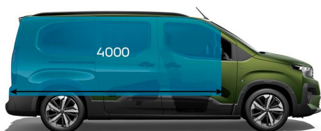
3 050 mm / 5-miestne usporiadanie, sklopené sedadlá v 2. rade a sedadlo spolujazdca