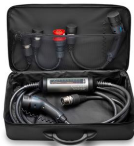
Súprava s nabíjacou jednotkou pre zapojenie do viacerých druhov elektrickej siete (230V/400V/WallBox) – 98 460 314 80