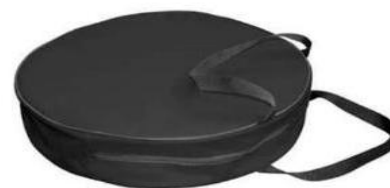
Taška na nabíjacie káble – 98 412 134 80