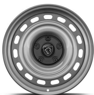
16" ocelové disky so stredovou krytkou

Cena pre: TURBO 110 + BlueHDi / Elektrické verzie