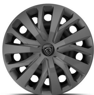
16" ocelové disky s krytmi kolies TONGARIRO