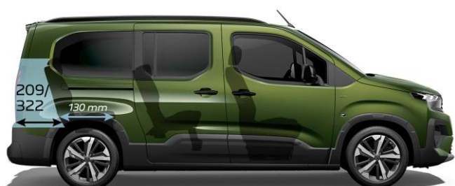
418 – 566 mm / 7-miestne usporiadanie