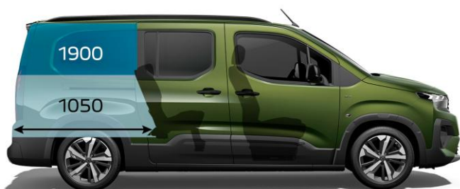
1 350 mm / 5-miestne usporiadanie