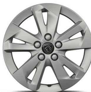
16" zliatinové disky TARANAKI