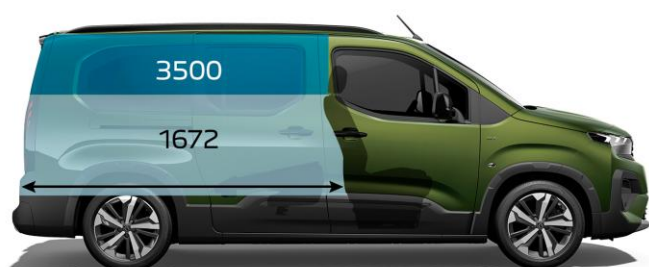
2 230 mm / 5-miestne usporiadanie, sklopené sedadlá v 2. rade