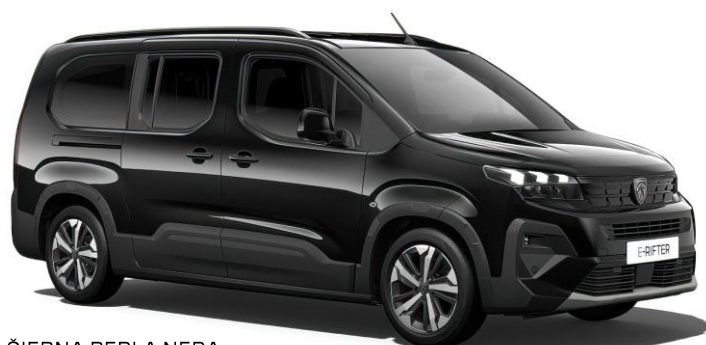
ČIERNÁ PERLA NERA