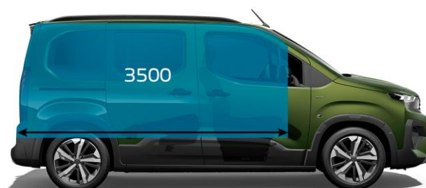
3 500 mm / 5-miestne usporiadanie, sklopené sedadlá v 2. rade a sedadlo spolujazdca