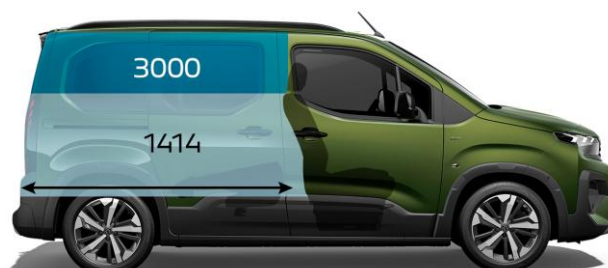
3 000 mm / 5-miestne usporiadanie, sklopené sedadlá v 2. rade