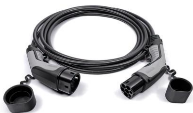
Kábel režimu 3 pre pripojenie do nabíjacej stanice (domáceho WallBoxu alebo verejnej stanice)