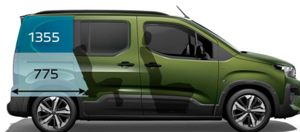
1 000 mm / 5-miestne usporiadanie