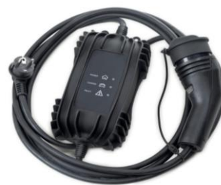
Štandardný kábel pre zapojenie do domácej 230V zásuvky – 98 505 251 80